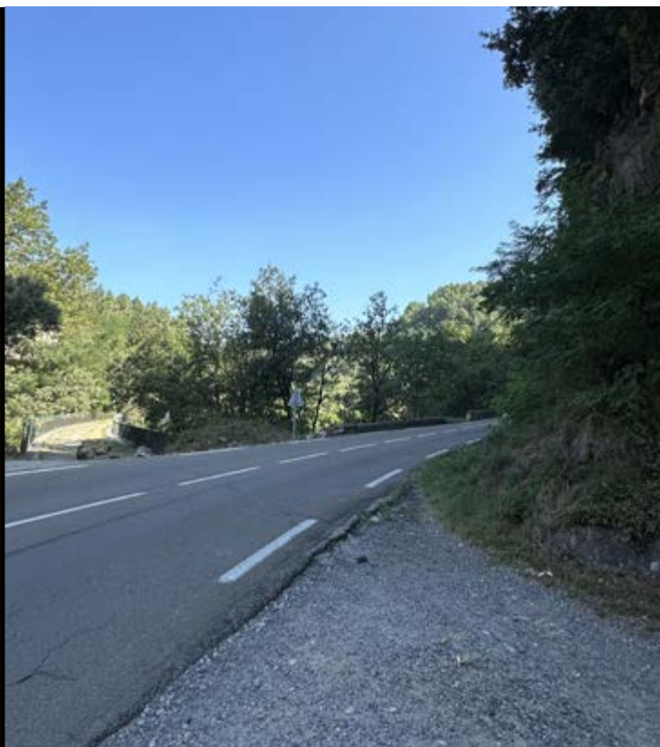
📷 Traversée à Les Chaulnes avant travaux