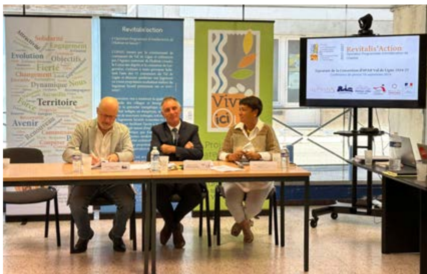
Signature de la convention d'OPAH 2024-27

C'est sur le bilan positif de la première Opération Programmée d'Amélioration de l'Habitat (OPAH) du Val de Ligne 2017-2023 que la collectivité renouvelle, avec l'Agence Nationale pour l'Amélioration de l'Habitat (ANAH) et la commune de Largentière, l'opération sur 2024-2027. Une convention d'OPAH a été signée le 19 septembre dernier en présence de l'ensemble des partenaires en ouverture d'un Comité de Pilotage du programme de revitalisation du territoire dont l'OPAH est une action forte.