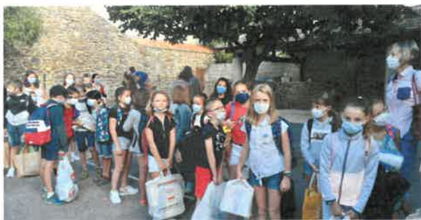
Ecole privée Frère Serdieu, rentrée des Cycle 3