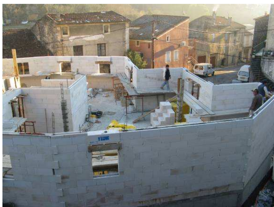
Avancement des travaux du bâtiment « bibliothèque » place Galfard

Mairie Rue Frère Serdieu 07110 Laurac-en-Vivarais Tel : 04 75 36 83 19 Fax : 04 75 36 86 46 Email : mairie@lauracenvivarais.fr Site Internet : http://www.lauracenvivarais.fr